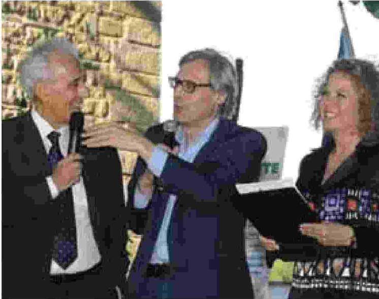
Vittorio Sgarbi testimone di un'edizione di Acquiambiente

» Cinquanta i volumi presentati in un anno reso ancora più significato dalla concomitanza con l'Expo 2015. Cerimonia conclusiva il 27 e 28 giugno