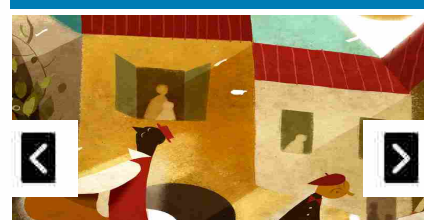
Angoli Segreti 2015

Il tuo browser non supporta i video HTML5